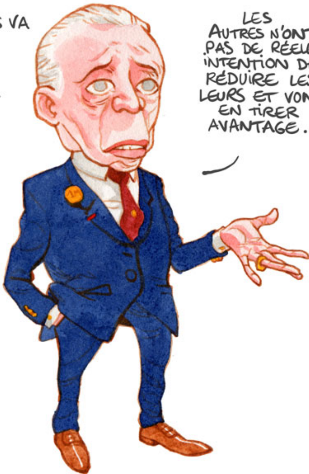
Fig.3. L'excuse du 'Free rider'.

LES AUTRES N'ONT PAS DE RÉELLE INTENTION DE RÉDUIRE LES LEURS ET VONT EN TIRER AVANTAGE.