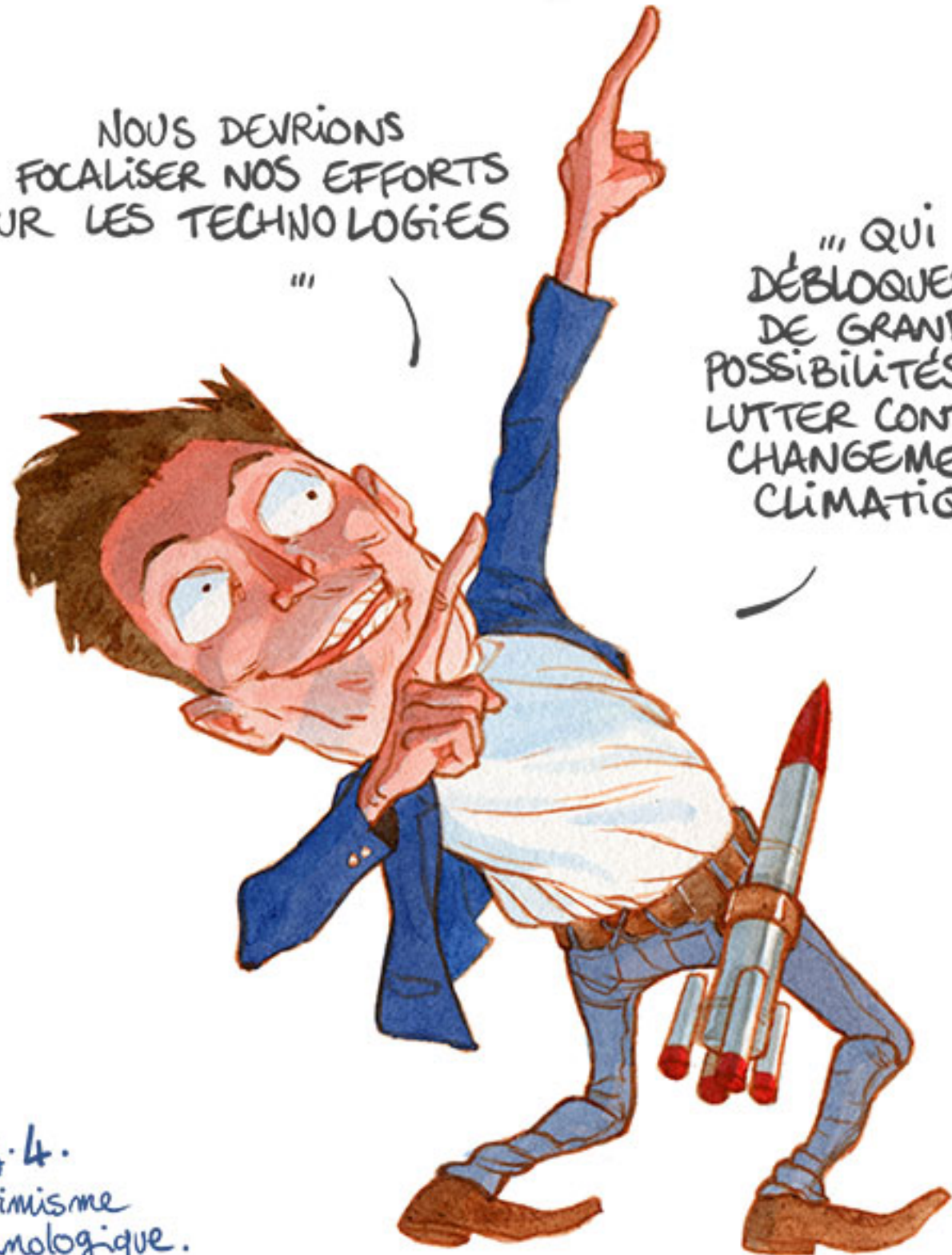
Fig. 4. Optimisme technologique.

''' QUI DÉBLOQUERONT DE GRANDES POSSIBILITÉS POUR LUTTER CONTRE LE CHANGEMENT CLIMATIQUE.