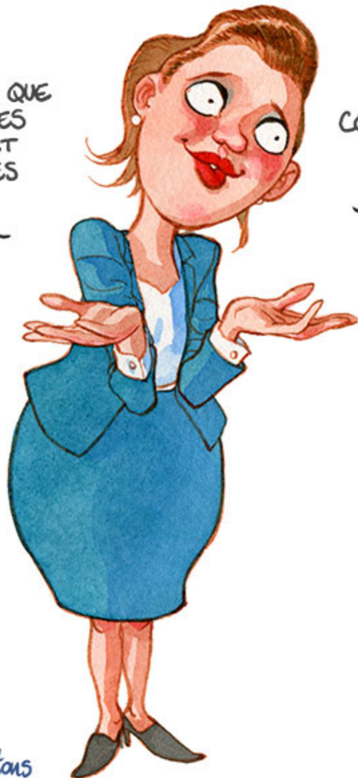
Fig. 7. Carottes sans bâtons

''' IL FAUT ÉVITER LES CONTRAINTES ET RESTRICTIONS.