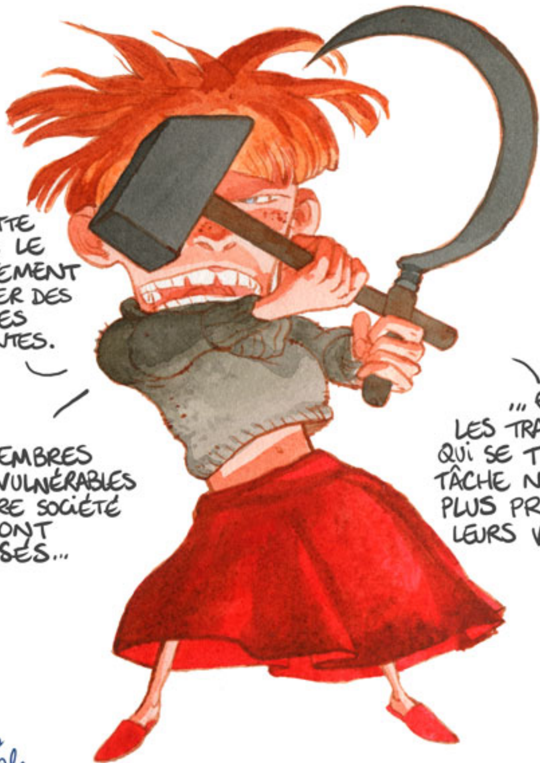
Fig.8. Appel à la justice sociale.

... ET LES TRAVAILLEURS QUI SE TUENT À LA TÂCHE NE POURRONT PLUS PROFITER DE LEURS VACANCES.