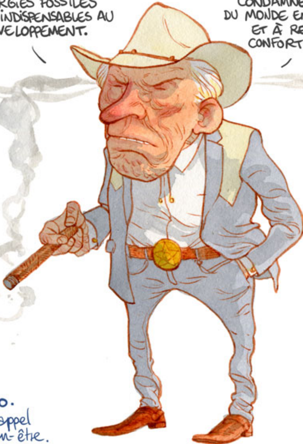
Fig. 10. Faire appel au bien-être.

LES ABANDONNER CONDAMNERAIT LES PAUVRES DU MONDE ENTIER À SOUFFIR ET À RENONCER AU CONFORT MODERNE.