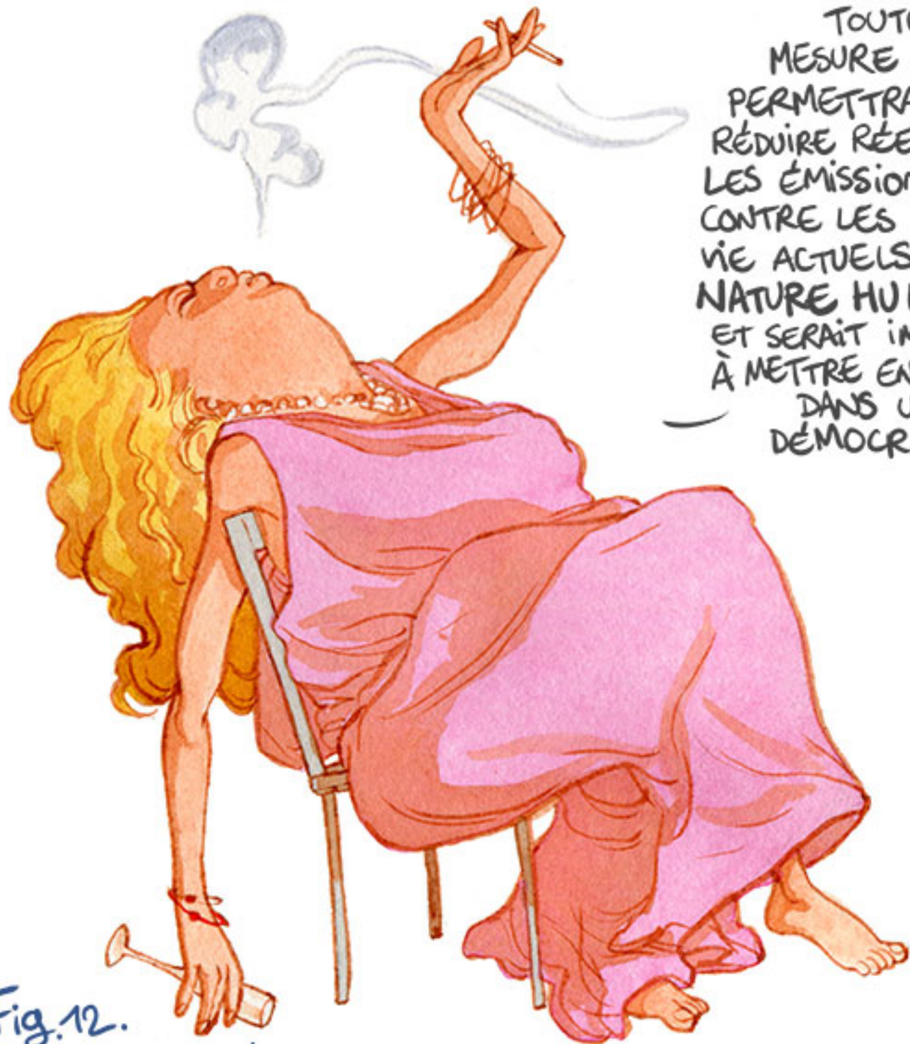
Fig.12. Dictature verte

TOUTE MESURE QUI PERMETTRAIT DE RÉDUIRE RÉELLEMENT LES ÉMISSIONS IRAIT CONTRE LES MODES DE VIE ACTUELS ET LA NATURE HUMAINE, ET SERAIT IMPOSSIBLE À METTRE EN ŒUVRE DANS UNE DÉMOCRATIE.