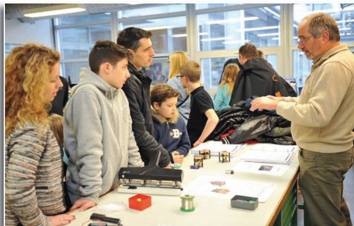
Pour les visiteurs, cette porte ouverte fournissait l'occasion rêvée de découvrir les sites du CPNV et de se renseigner sur les filières et leur contenu.